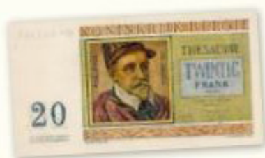
► Philippus De Monte sierde jarenlang het Belgische briefje van twintig frank