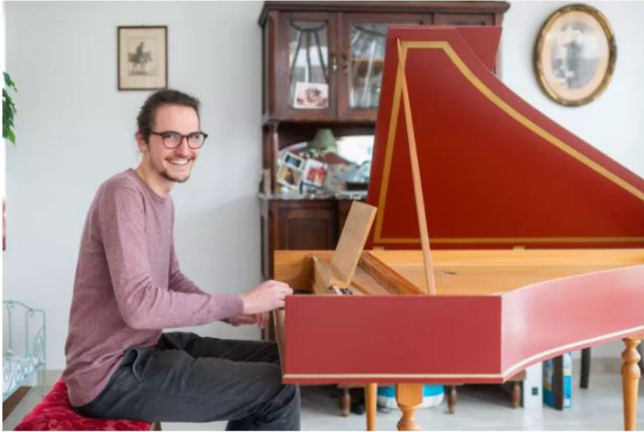
Componist Noah Senden

Doneren via verschillende formules kan nog tot en met zondag 2 mei. Meer info vind je hier .