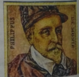
Lunalia staat in het teken van de 500ste verjaardag van Philippus De Monte.