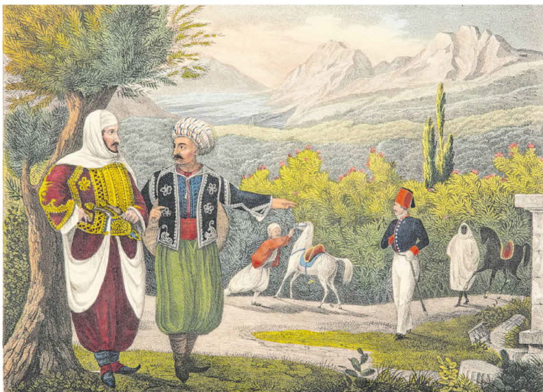
„Halt bei Thugga“, Illustration aus dem „Atlas zu Semilasso in Afrika“ von Kaspar Obach, 1836.

Schon im Oktober sind für das Karawanen-Projekt 114 000 Euro aus dem Sofortmaßnahmenprogramm „Kulturelle Heimat“ des Bundes zur Strukturstärkung in den Braunkohlegebieten bewil-