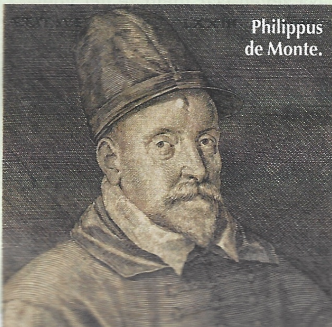
Philippus de Monte.

>> Alle info over Lunalia en de concerten (23 april - 8 mei) op lunalia.be